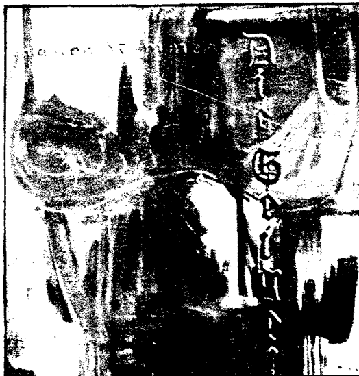
«Abstraktos bild 29 D», óleo de Albert Oehlen.